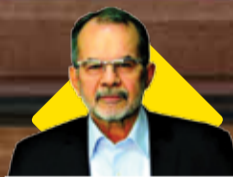
مدیرعامل سازمان منطقه آزاد اروند اظهار داشت:

آغاز پروژه تپه آپرونده ارس چیست ثبت آثار ملی