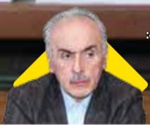
مدیرعامل سازمان منطقه آزاد ارس اظهار داشت:

آغاز پروژه تپه آپرونده ارس چیست ثبت آثار ملی