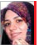
گزارش: ملیحه اسناوندی