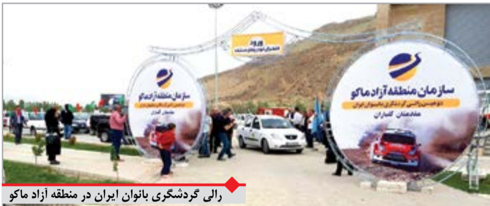
رالی گردشگری بانوان ایران در منطقه آزاد ماکو

از سوی دیگر فرار انسان‌ها از زندگی ماشینی و تمایل به انجام فعالیت‌های ورزشی و تفریحی در طبیعت، بستر مناسبی را برای سرمایه‌گذاری در صنعت توریسم فراهم آورده؛ زیرا براساس برآورد سازمان جهانی جهانگردی ۲ میلیارد دلار درآمد حاصل از همین موضوع بوده است. بنابراین قرن ۲۱ قرن برداشتن گام‌های طلایی برای حفاظت از طبیعت، معنویت و سلامت است و در این راستا جوامع انسانی و همچنین بانوان نقش بسیار سازنده‌ای به سوی آینده خواهند داشت.