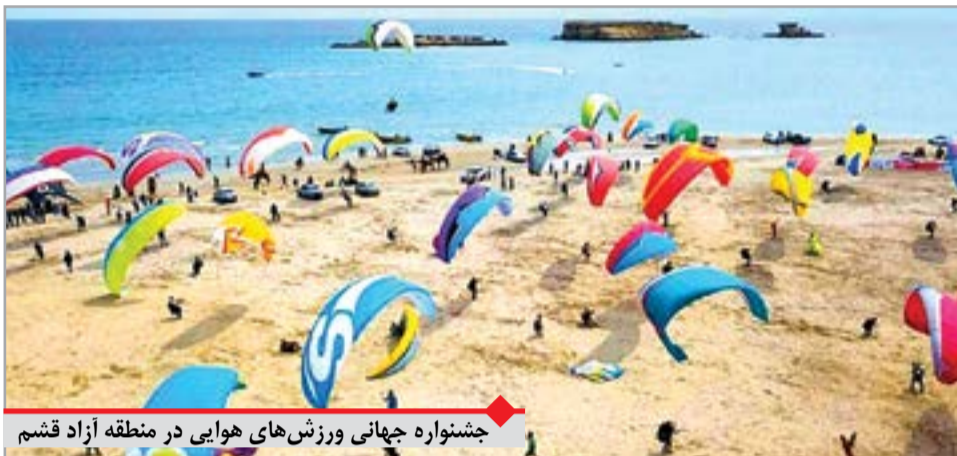
جشنواره جهانی ورزش‌های هوایی در منطقه آزاد قشم