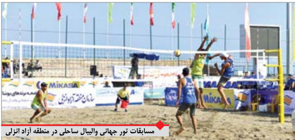
مسابقات تور جهانی والیبال ساحلی در منطقه آزاد انزلی

به هر حال برگزاری تورنمنت‌های ورزشی آن هم در سطوح بالای بین‌المللی و تحولات عظیم و مثبت سیاسی، اقتصادی، فرهنگی، اجتماعی و ورزشی که برای کشور میزبان به ارمغان می‌آورد، به قدری برای کشورهای توسعه‌یافته و مترقی اهمیت دارد که بسیاری از دولتمردان این کشورها برای به دست آوردن میزبانی رقابت‌هایی همچون المپیک، جام‌جهانی و مسابقات منطقه‌ای و قاره‌ای به انواع راه‌ها و روش‌ها متوسل می‌شوند؛ تا جایی که حتی حاضرند از راه‌های غیر قانونی نیز برای رسیدن به این موفقیت استفاده نمایند.